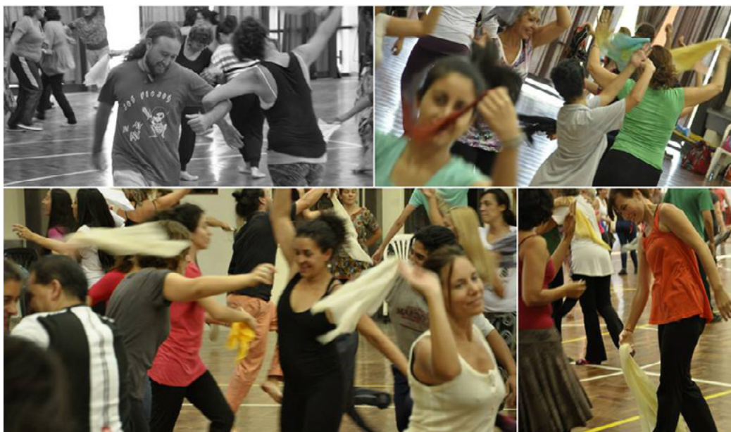
Figura 1. Registros de momentos de clase. Autora: Laura Ávalos