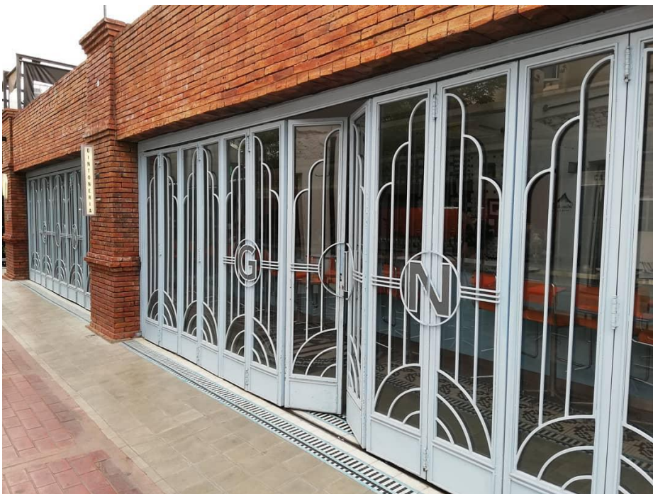
Figura N° 6 La Gintonería Autor María José Cuenca