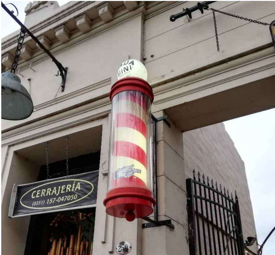
Figura N° 5 Simbología de Barbería Autor María José Cuenca