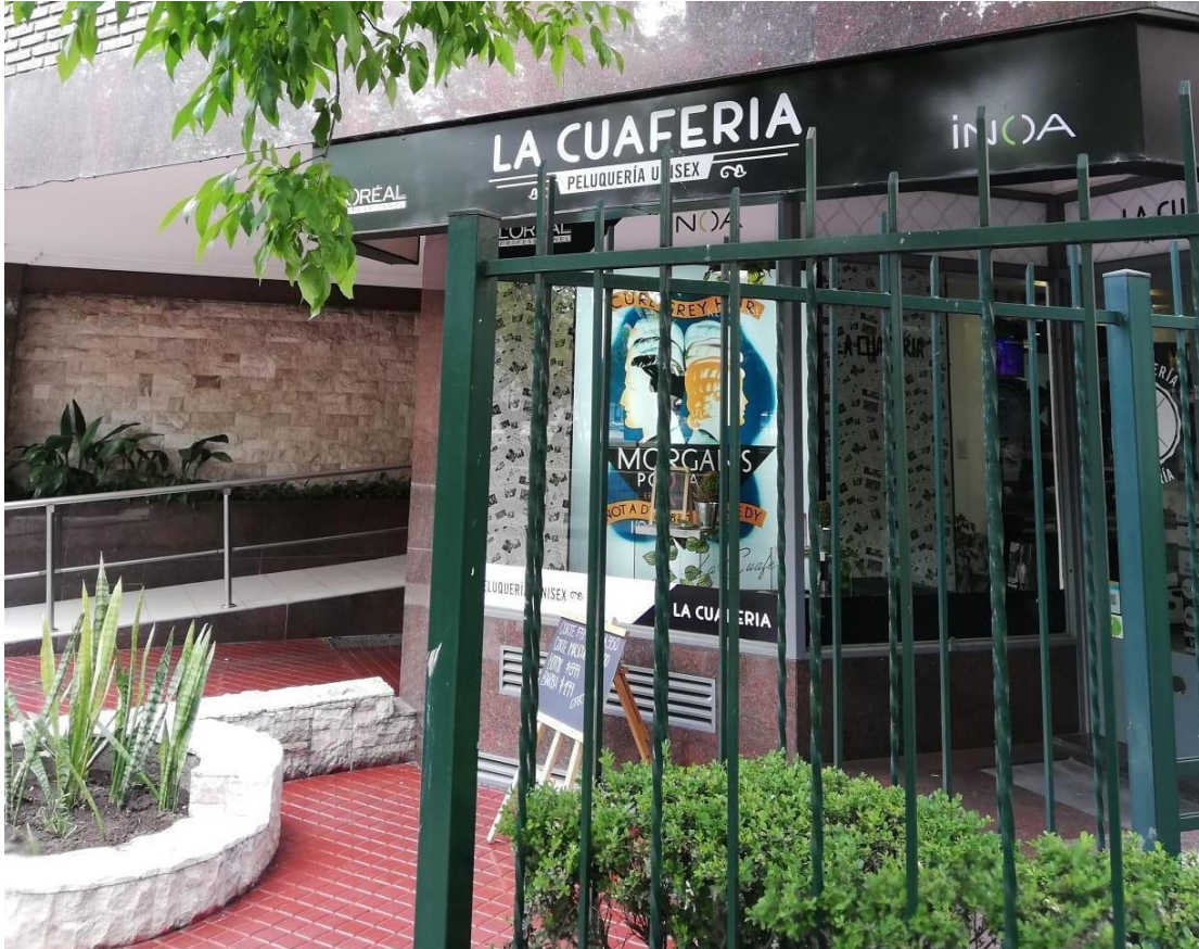
Figura N° 3 La Cuaferia Autor María José Cuenca

quede, pero que tenga otro significado, a mí me parece muy bueno. Porque también es una manera de rendir historia, a lo que fue, lo que significó.