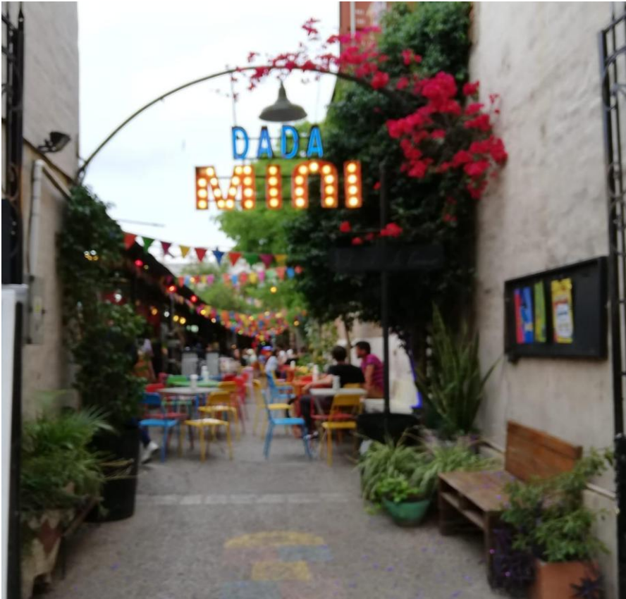
Imagen N° 7 Dadá Mini Bar Autor María José Cuenca