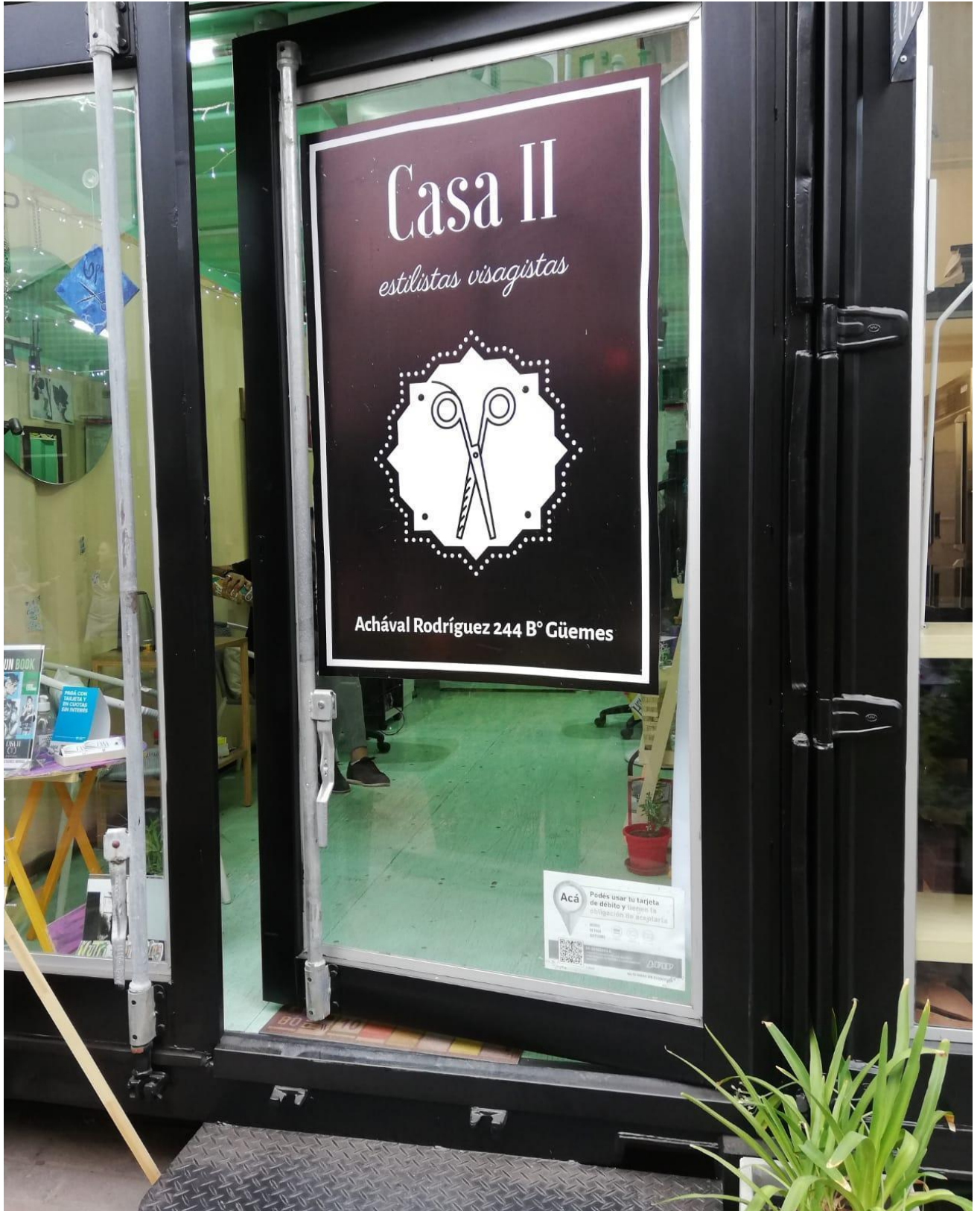
Figura N° 4 Estilos Visagistas Autor María José Cuenca