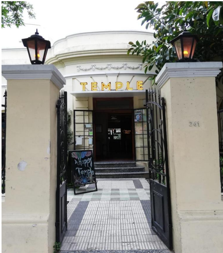
Figura N° 9 Temple Bar Autor María José Cuenca